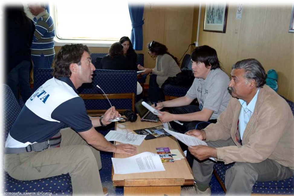
Mesa de Trabajo

Existe un pensamiento global acerca de Chile como país con un alto desarrollo Náutico dado que se encuentra de cara al Pacífico, creando con esto un concepto idealizado de “Chile, país marítimo”, y de alguna manera potenciado por publicidades gubernamentales. Pero esta imagen es equívoca, ya que no existe un desarrollo náutico real, sino un país con gran territorio marítimo.