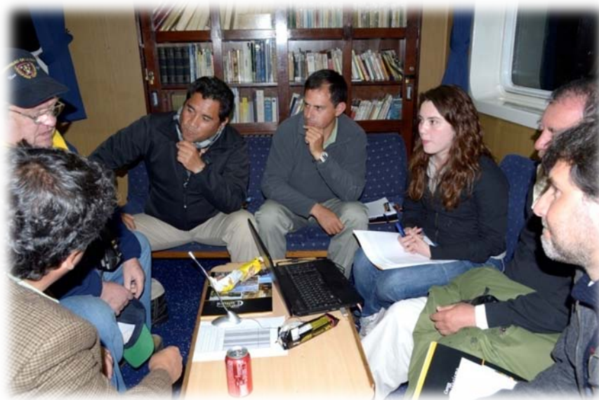
Mesa de Trabajo