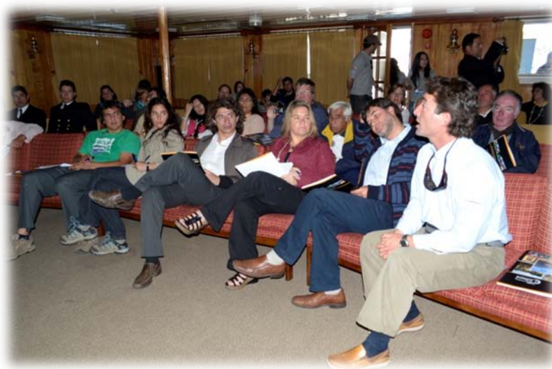
Discusiones en sala

Gran parte de las discusiones se centraron en la evidente disminución de llegadas de cruceros a la bahía de Valparaíso, problema que se atribuyó principalmente a los elevados costos que deben cancelar los cruceros por navegar por aguas chilenas y recalar en nuestros puertos.