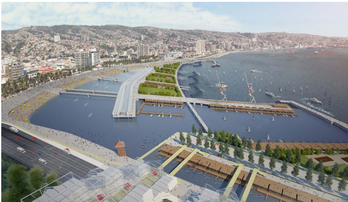
Propuesta alternativas Parque del Mar a Puerto Barón, Ivelic, Segura y Vásquez